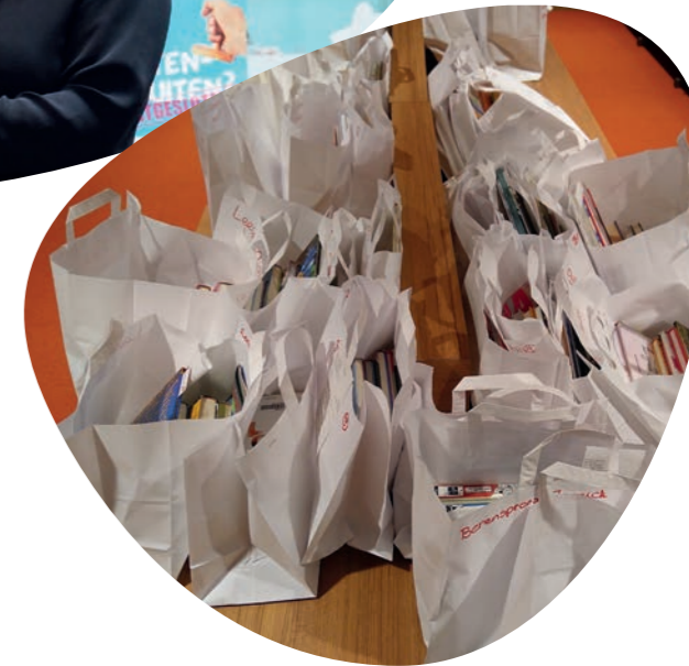
Verassingstasjes van de leesconsulenten