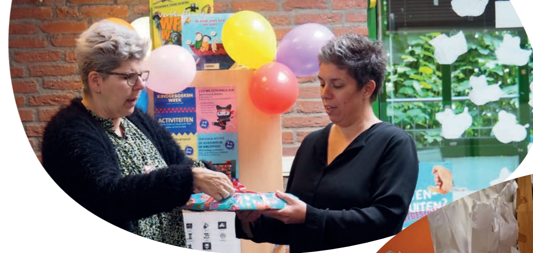
Opening van de schoolbib op Alhambraa