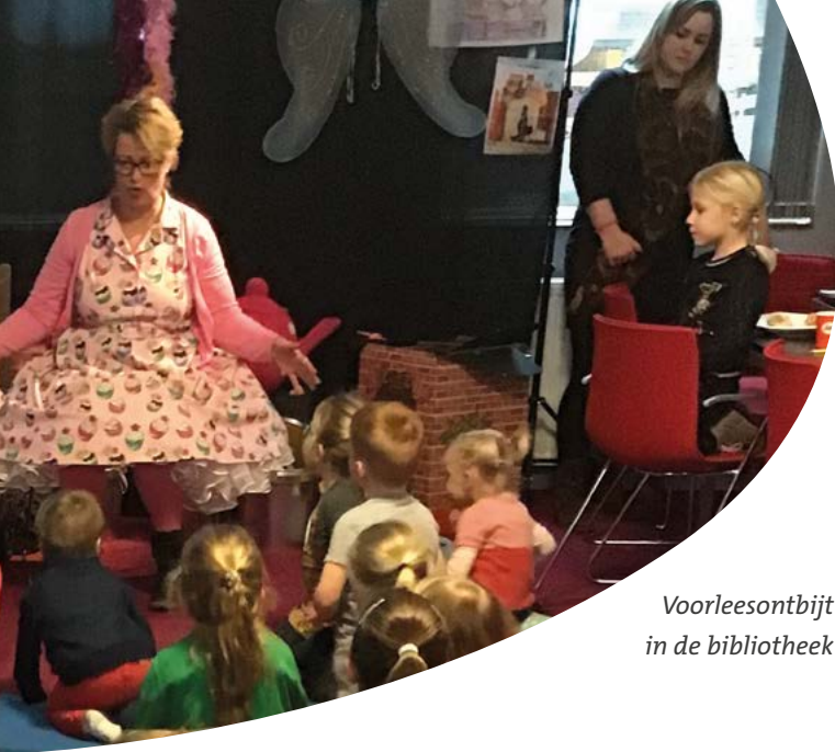
Voorleesontbijt in de bibliotheek