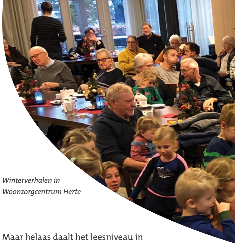
Winterverhalen in Woonzorgcentrum Herte

‘Een druk jongetje van 2 jaar rent op en neer in het consultatiebureau. Mama zegt dat hij nooit voorgelezen wil worden. De BoekStartcoach neemt hem op schoot en begint voor te lezen en te zingen. Het jongetje ontspant zich, leunt lekker achterover en komt tot rust. Mama kijkt met verbazing toe.’